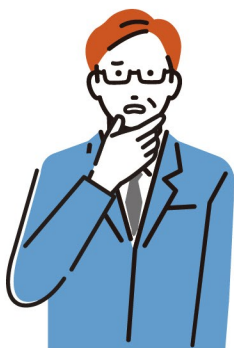
管理部門・経営者